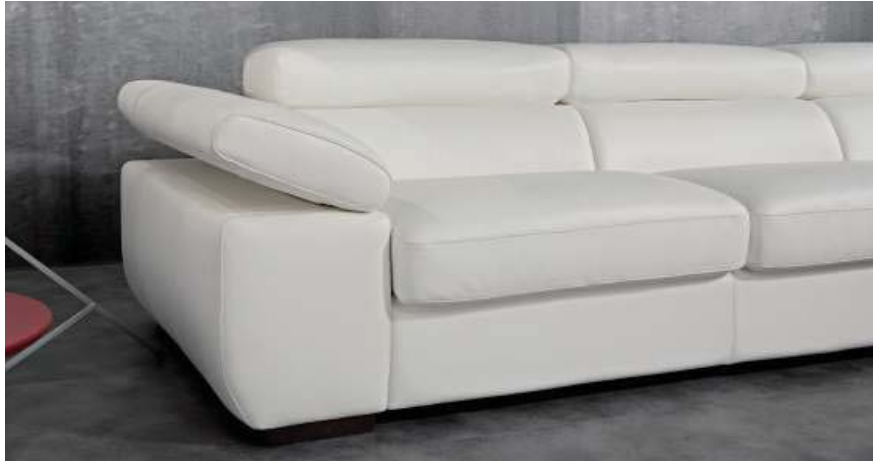
Bracciolo dotato di meccanismo a cricchetto per un confort personalizzato e uso informale del divano. The armrest is provided with a ratchet adjustment mechanism to have a personalized comfort.