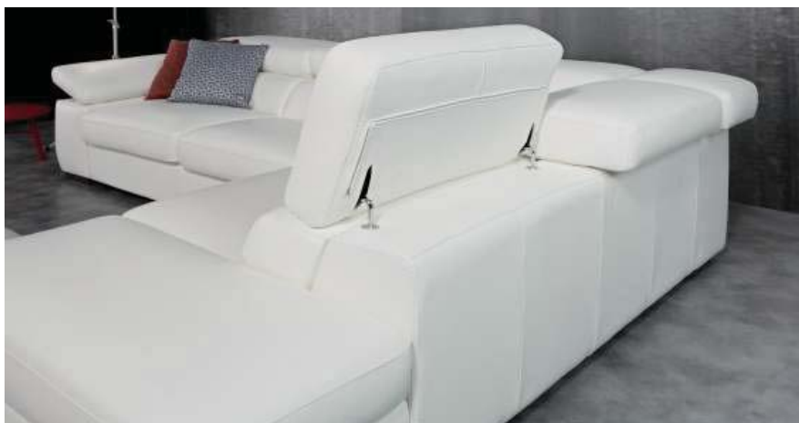
Tutti i poggiatesta sono dotati di meccanismo a cricchetto regolabili. All the headrests are provided with a ratchet adjustment mechanism.