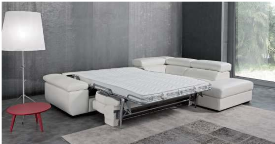
Divano versatile con la versione letto con materasso da cm 12, inoltre dotato di sedute estraibili e bracciolo e poggiatesta con movimento a cricchetto. It's a versatile sofa characterized by the bed version with a 12 cm mattress. It is also provided with extractable seat cushions and armrest and headrest are provided with a ratchet adjustment mechanism.