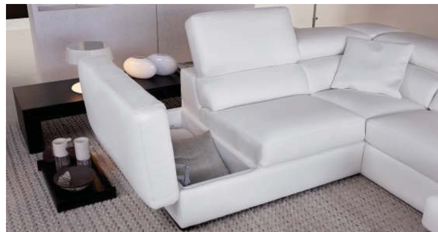
La praticità del terminale che può contenere un comodo vano contenitore interamente rifinito. The terminal armchair corner is very practical thanks to a comfortable storage box completely finished.